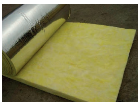
laine de verre ...