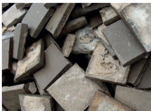
dalles de trottoir ...