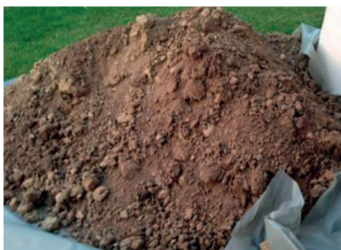
terre de creusage ...