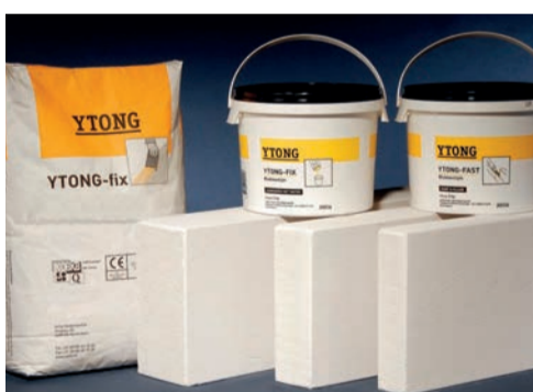
béton cellulaire ...