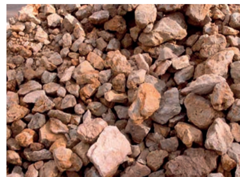
pierres naturelles ...