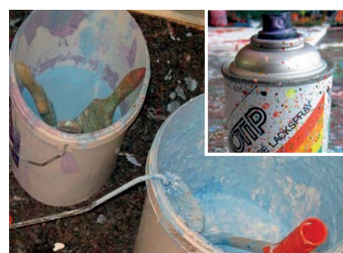
peintures et aérosols ...

!!! Les coûts dus au non-respect de ces dispositions seront facturés aux contrevenants