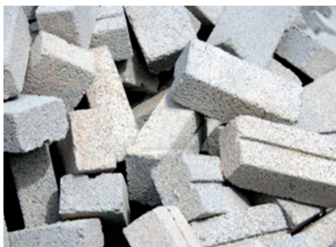
briques ciment, béton ...