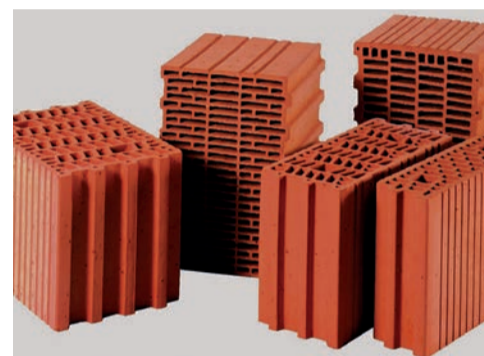
blocs de construction ...