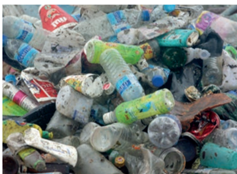
toutes sortes de plastique ...