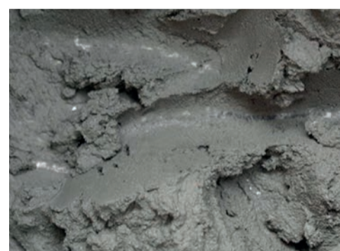
béton et colles liquides ...