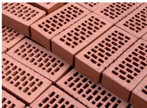
briques en terre cuite ...